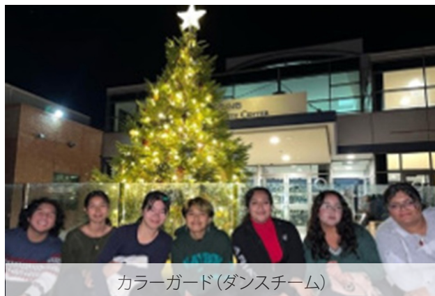
カラーガード(ダンスチーム)