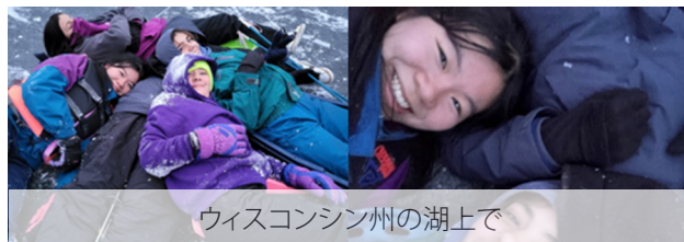
ウィスコンシン州の湖上で

メキシコ出身である長女の旦那さんやホストカズンも英語を学んでいる最中なので意思疎通に困ることもありますが、すぐに仲良くなることができました。私がスペイン語を話すととても喜んでくれます。互いの言語、文