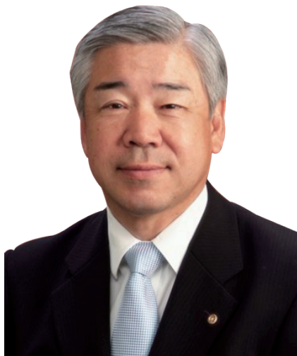
国際ロータリー第2670地区 2023-2024年度 ガバナー