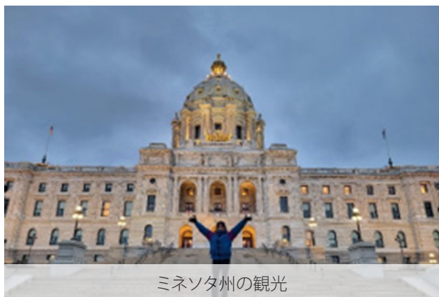
ミネソタ州の観光

治安の悪さを目の当たりにしたことや、実際に怖い目に遭いそうになったこと、人種や出身国によって違う対応を受けたこともあり楽しいことばかりではありませんが、ホストファミリー、街の人、学校の友達、ロータリークラブの人々、世界中から来たインバウンドの仲間と交流を深め、とても濃密な毎日を送っています。皆様にはいつもサポートいただき本当に感謝しています。