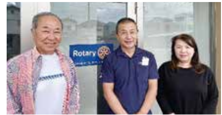
ガバナー事務所前にて