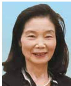
青少年奉仕委員会 委員長