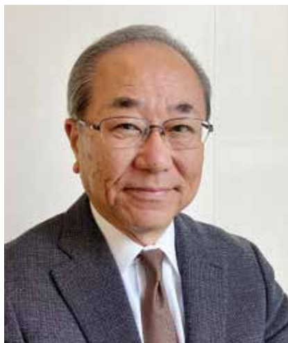
国際ロータリー第2670地区 2022-2023年度 ガバナー