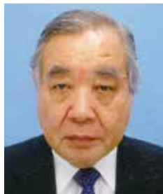
国際奉仕委員会 委員長