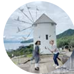
エクスカージョン (オリーブ公園)

最後になりましたが地区大会開催に当たりご協力いただきました関係各位の皆様にご心より御礼を申し上げますと共に地区内ロータリークラブ会員の皆様のご健勝とご多幸を祈念し御礼のご挨拶とさせていただきます。