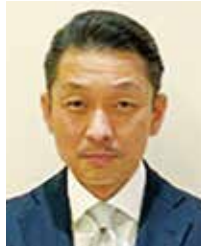
昌山 巧 観音寺RC