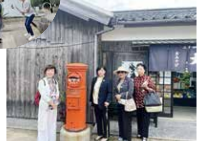
エクスカージョン (二十四の瞳映画村)