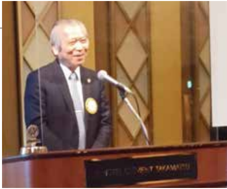
◀2023年3月8日 卓話 高松南RC・高松北RC合同例会にて