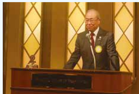
八田 光ガバナー ▶