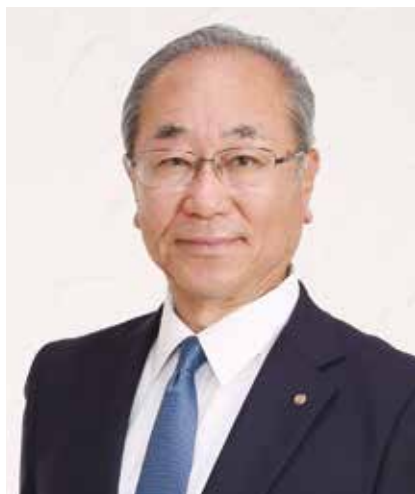
国際ロータリー第2670地区 2022-2023年度 ガバナー